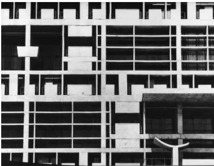
Chandigarh secretariat, 40 x 30,2 cm