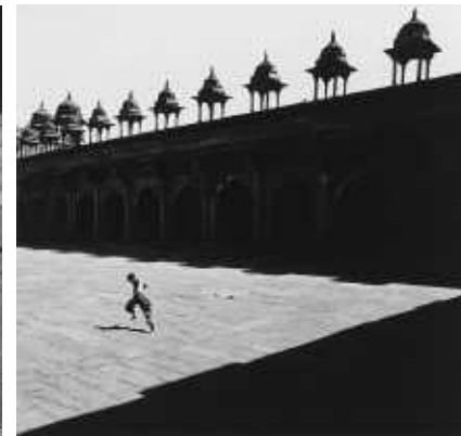
Fatehpur, Sikri, Inde, 25 x 26 cm