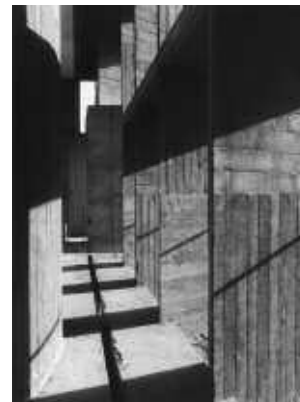
Ahmedabad : Mill Owners, 1955, 28 x 38 cm