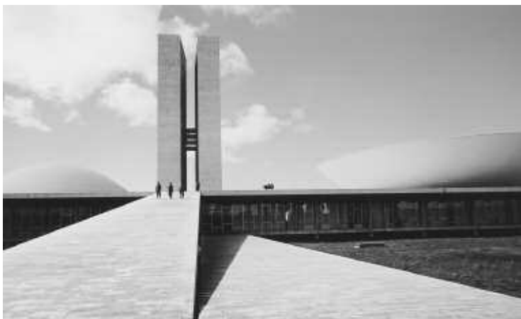
Oscar Niemeyer, Brasilia, 23,7 x 39,2 cm

« Dans les photographies de Lucien Hervé l'ombre et la lumière forment des contrastes riches et parfois violents, des compositions où se retrouvent sans doute les traces proches ou lointaines des recherches du Bauhaus ou des constructivistes, en tous cas le goût de ré-interprétation et de structuration du monde, de l'invention permanente »